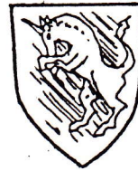
Prince Vodalon of Norgales