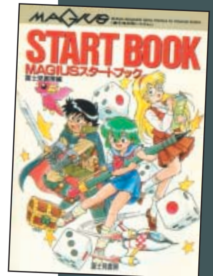
Magius Start Book

Hur det ser ut på de företagssponsrade rollspelskonventen vet jag inte, men på dessa seriemässor deltar rollspelsföreningar som säljer sina alster. Och det är minst sagt imponerande verk de presenterar. Allt från handskrivna entusiastverk till fantastiskt vackra färgtryckta, tjocka A4-häften. GURPS -moduler, egna världar. Eller vad sägs om Hundarna från Catan , ett Settlers -plagiat där man skall sprida ut sitt revir genom att pissa i gatuhörnen? Av någon anledning är kreativiteten enorm, kanske för att möjligheterna att skapa och sälja finns. Det är inte bara företagen som är aktiva i den japanska rollspelsvärlden.