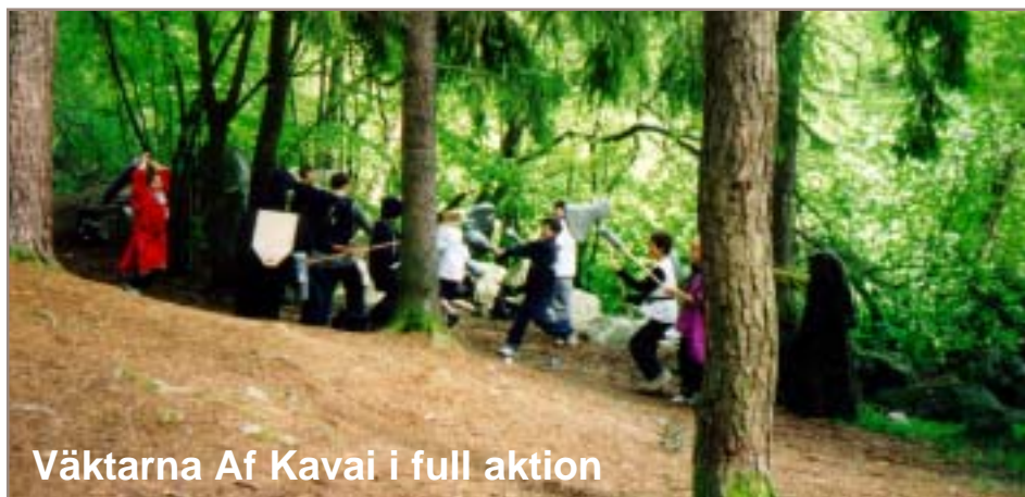
Väktarna Af Kawai i full aktion

...föreningar än någonsin tidigare. Den ... gersson brukade tala om Sverok – ... tingen har aldrig stämt bättre, här ... ogs under oktober och november.