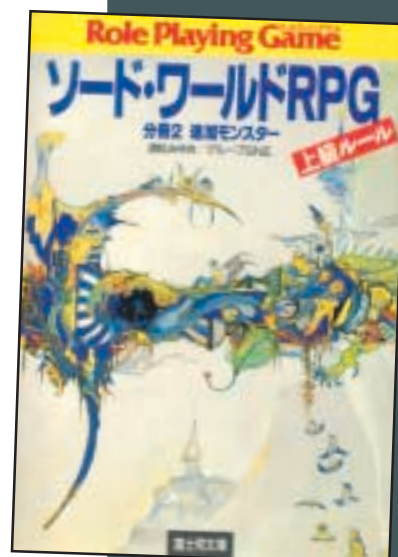
Sword World Adventure, bok 2