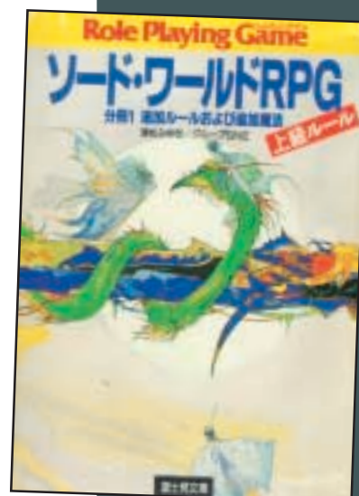
Sword World Adventure, bok 1