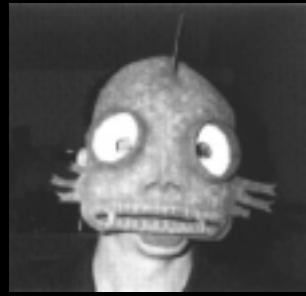
Jeg er din værste skræk!

Scenariet starter morgenen efter denne fest. Alle har lært hinanden lidt at kende dagen før, men det hele fortaber sig i tågerne. Faktisk står det ikke helt klart hvad der egentlig foregik i løbet af nattens udskejelser. Nogle ubehagelige minder ligger dog lige under overfladen og ulmer.