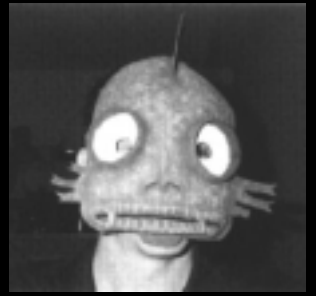
Jeg er din værste skræk!

Scenariet starter morgenen efter denne fest. Alle har lært hinanden lidt at kende dagen før, men det hele fortaber sig i tågerne. Faktisk står det ikke helt klart hvad der egentlig foregik i løbet af nattens udskejelser. Nogle ubehagelige minder ligger dog lige under overfladen og ulmer.