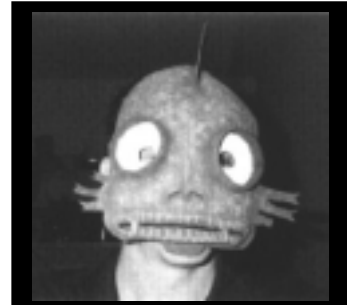
Jeg er din værste skræk!

Scenariet starter morgenen efter denne fest. Alle har lært hinanden lidt at kende dagen før, men det hele fortaber sig i tågerne. Faktisk står det ikke helt klart hvad der egentlig foregik i løbet af nattens udskejelser. Nogle ubehagelige minder ligger dog lige under overfladen og ulmer.